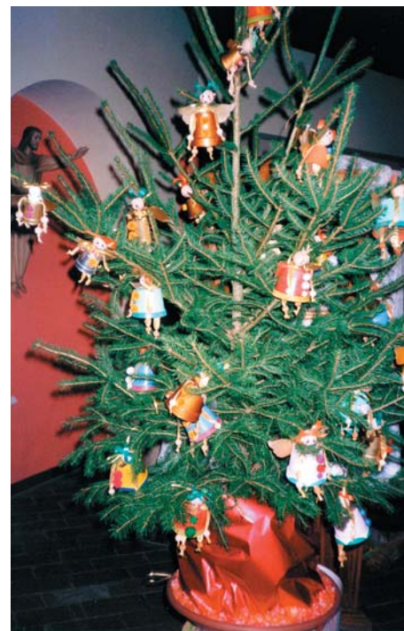
Albero di Natale del Gruppo di Volontariato

Anche nel 2005 il Centro Sociale Argento coinvolgerà i propri soci con un ricco calendario di appuntamenti, a partire dal 19 marzo, con la Festa del Papà presso i locali dell'associazione, per arrivare al Primo Maggio, animato dalla tradizionale Festa in Fiore. Non mancherà neppure attività creative come i corsi di tombolo, cucito, ricamo e taglio,