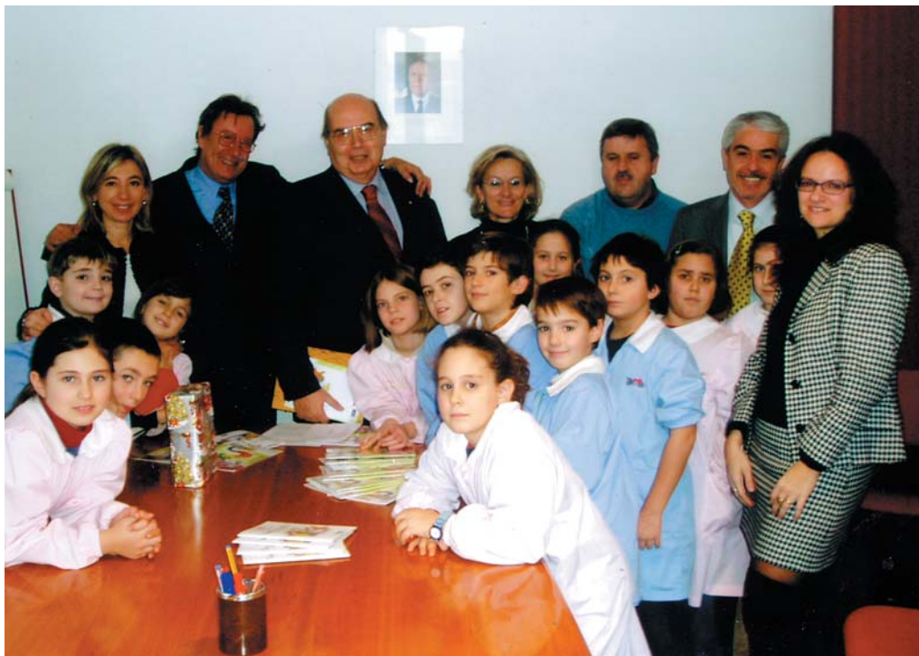
In basso gli alunni della classe IIIA della Scuola Elementare di Gradara.