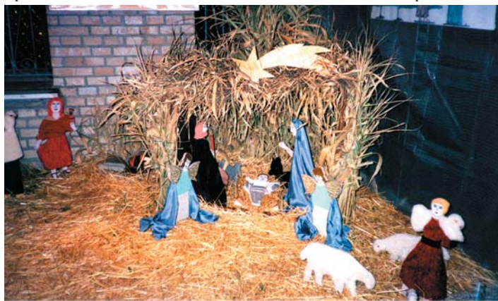
Presepe del Gruppo di Volontariato

Ciò che il Gruppo si propone per il futuro è soprattutto sensibilizzare il ragazzi delle scuole sull'esistenza e il significato del volontariato - pur mantenendo la massima apertura verso tutti coloro che saranno disponibili a