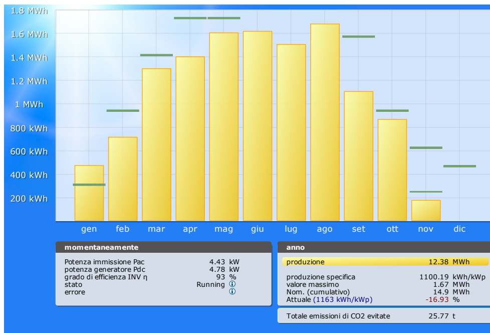
Grafico della produzione annuale 2014 (fino a novembre) dell'energia prodotta e delle emissioni di CO 2 evitate grazie all'impianto sulla scuola dell'infanzia

scuola primaria: http://home1.solarlog-web.it/232.html